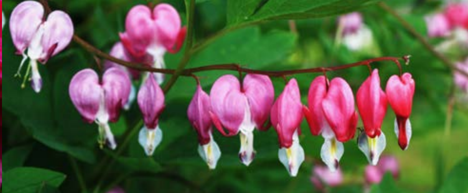
Tränendes Herz

Am Abfuhrtag müssen die Tonnen bis 6:30 Uhr zur Leerung bereitgestellt sein!