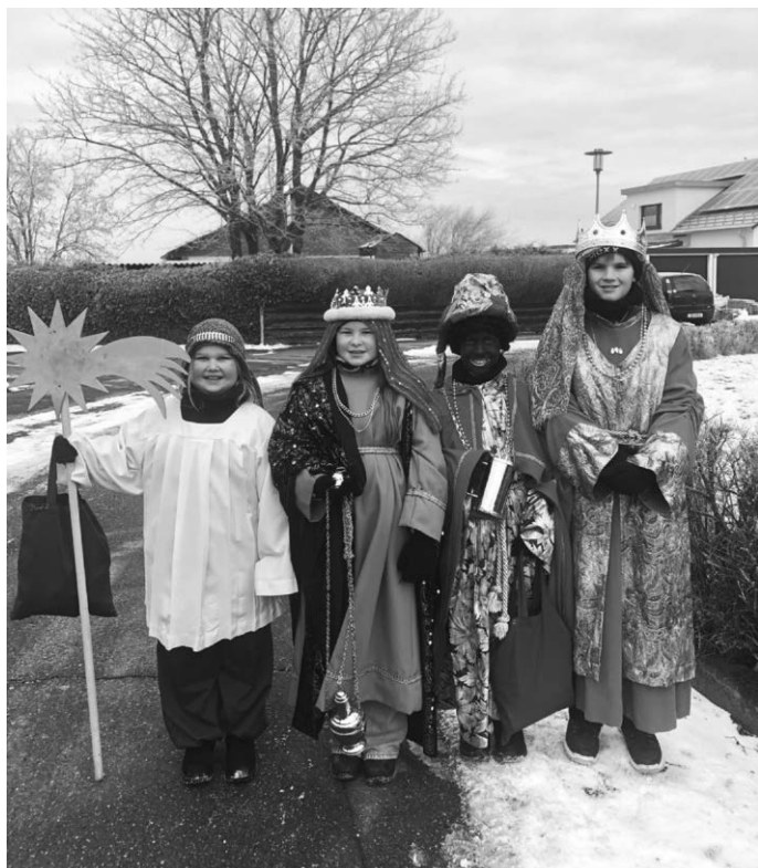
Kinder mit Freude als Sternsinger unterwegs von Haus zu Haus

In Mittelbuch, Bebenhaus, den Einöden und Diengen waren am 4. und 6. Januar 2026 insgesamt 6 Sternsinger-Gruppen unterwegs. In selbstgenähten königlichen Gewändern zogen die Kinder als Heilige Drei Könige von Haus zu Haus und brachten den Menschen den Segen für das neue Jahr. Durch großzügige Spenden der Gemeindemitglieder kam eine beachtliche Spendensumme von rund 3700 Euro zusammen, was ein Rekordspendenergebnis seit den letzten Jahren ist. Darüber sind wir sehr dankbar und haben uns sehr gefreut. Herzlichen Dank an alle Kinder, die dabei waren, an alle, die die Tür geöffnet und gespendet haben und an alle Helfer und Eltern, die unterstützt haben.