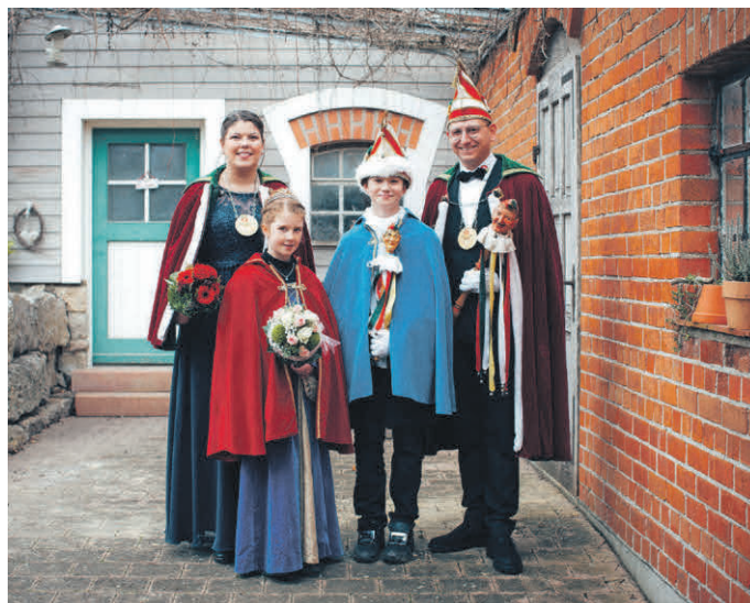
Die Prinzenpaare der Karnevalgesellschaft-Narrenzunft Ochsenhausen (KGO) haben in Ochsenhausen die Macht übernommen.

Ab Aschermittwoch (18. Februar) gelten wieder die regulären Öffnungszeiten.