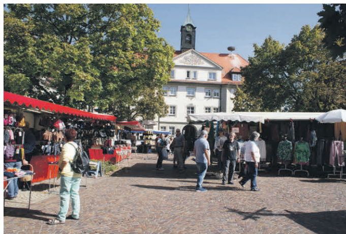
Herzliche Einladung zum Besuch des Markts!