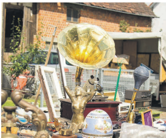
Flohmarkt beim Öchslefest in Ochsenhausen

Anmeldungen: Sollten in diesem Jahr bis spätestens 10. Mai 2026 eingegangen sein, spätere Anmeldungen können eventuell nicht mehr berücksichtigt werden.