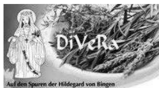
Auf den Spuren der Hildegard von Bingen