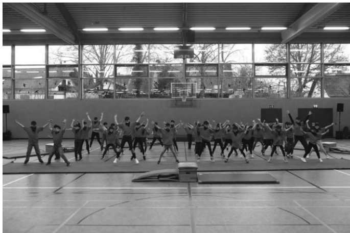
Stellten mit 40 Kindern die größte Gruppe - die Turnkinder des Donnerstagsturnens