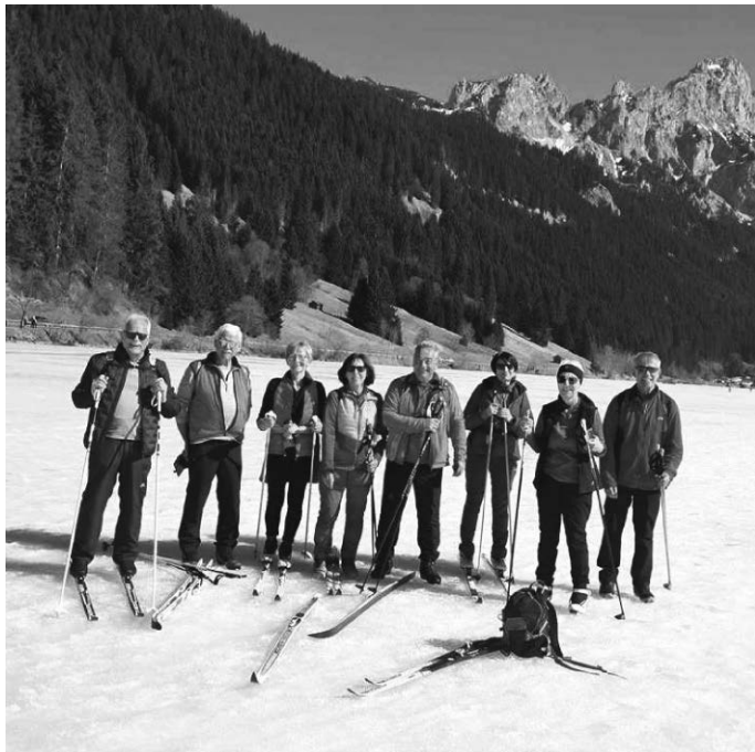
Eine Spurwechsel-Gruppe beim Ski-Langlauf im Tannheimer Tal im Jahr 2025

Der Arbeitskreis Spurwechsel-Senioren in Ochsenhausen wird getragen von der Evangelischen Kirchengemeinde Ochsenhausen und der Katholischen Kirchengemeinde Ochsenhausen-Erlenmoos. Die gedruckten Jahresprogramme liegen in verschiedenen Einzelhandelsgeschäften, den Banken, Kirchen und in der Tourist-Info der Stadt Ochsenhausen auf.