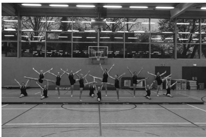
Bildeten den krönenden Abschluss des Jubiläumsveranstaltung - die Leistungsturnerinnen des SVÖ.