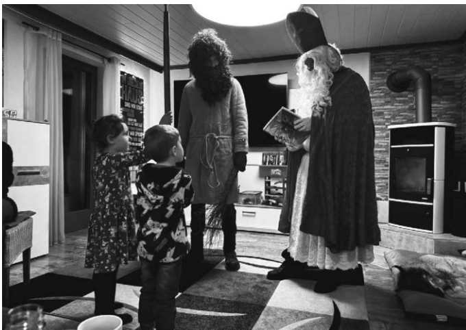
Nikolaus und Knecht Ruprecht bei den Kindern.

Auch in diesem Jahr zogen der heilige Nikolaus und sein Begleiter Knecht Ruprecht wieder traditionell im Auftrag des Fördervereins Kindergarten Laubach e. V. durch die Laubacher Gassen.