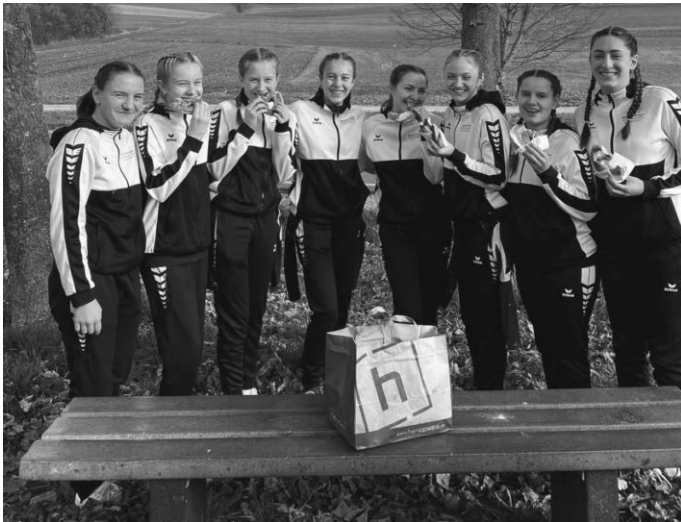
Bestens umsorgt mit den leckeren Butterbrezeln vom hampwerk.