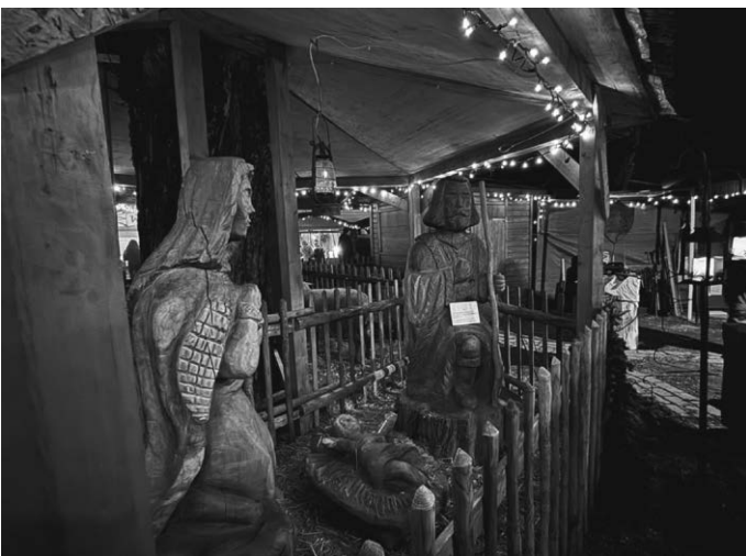
Die Heilige Familie mit dem Kind in der Krippe lud neben der Klosterkirche zum Innehalten ein.