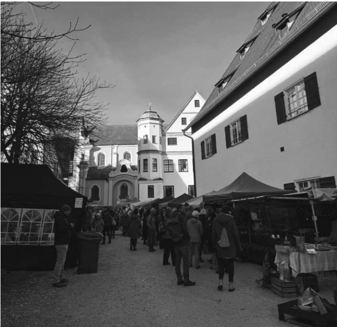
Beim Tag der Schulen und Vereine gab es viel Selbstgemachtes zu entdecken.