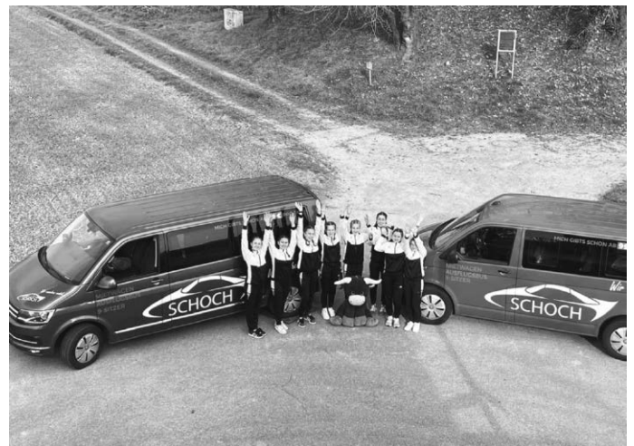
Der SV Ochsenhausen unterwegs mit zwei Kleinbussen von Schoch Automobile in Reinstetten.

Für die Turnerinnen des SV Ochsenhausen war das Landesfinale eine tolle Erfahrung, sie müssen sich selbst auf Landesniveau nicht verstecken und können sehr stolz sein, was sie sich in den letzten Jahren erarbeitet haben.