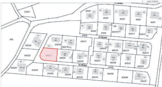
Bauplatz Flst. Nr. 643/21 im Baugebiet „Im Birket“

Anmerkung: Die Stadtverwaltung Ochsenhausen übernimmt für die hier gezeigten Geodaten keine Gewähr für Vollständigkeit, Aktualität, Genauigkeit und Richtigkeit.