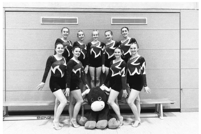
Die Leistungsturnerinnen des SV Ochsenhausen mit ihrem Maskottchen Ochi beim Landesfinale in Leutenbach.