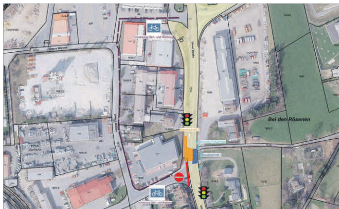
Im Plan sind die Sperrungen während des Baus der Querungshilfe farblich markiert.

Die Ulmer Straße in Ochsenhausen wird im Bereich der Einmündung zu den „Unteren Wiesen“ zur Baustelle. Dort wird die langersehnte Querungshilfe für Fußgänger und Radfahrer gebaut. Außerdem wird auch noch das Baugebiet „Bei den Rösenen“ an den Kanal angeschlossen. Dafür muss die Ulmer Straße für den Fahrzeugverkehr an dieser Stelle gesperrt werden. Mit einer halbseitigen Sperrung und einer Ampel werden die Fahrzeuge an der Baustelle vorbeigelotst. Für die Fußgänger wird während des ersten Bauabschnitts ein Notweg eingerichtet. Für die Dauer des zweiten Bauabschnitts müssen Fußgänger und Radfahrer einen kleinen Umweg über den Parkplatz des Einkaufszentrums zu den „Unteren Wiesen“ zurück auf die Ulmer Straße in Kauf nehmen. Dies gilt auch in der umgekehrten Richtung. Komplette gesperrt wird die Zufahrt von der Ulmer Straße in die „Unteren Wiesen“. Hier erfolgt die Umleitung über die Biberacher Straße (B 312) und die Güterbahnhofstraße. Die Bauarbeiten beginnen am Montag, 17. März, und werden bis voraussichtlich 25. April dauern.