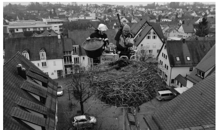
Erst durch einige wuchtige Schläge mit der Kreuzhau konnte der Inhalt des Storchennests gelockert und ausgegraben werden.