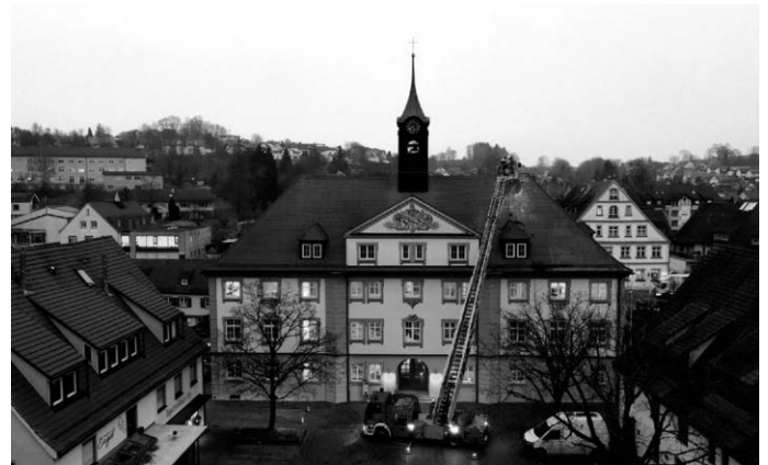
Abendimpression des Rathauses