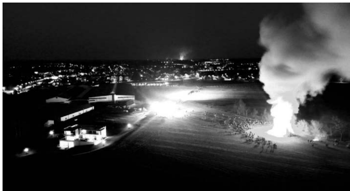
Die Drohne der Freiwilligen Feuerwehr verfolgte das Abbrennen des Funkens aus der Luft.

Die Jugendfeuerwehr und die aktive Feuerwehr bedankten sich beim Eigentümer des Feldes dafür, dass sie dort ihren Funken hatten errichten dürfen. Und alle Beteiligten waren sich einig, dass es im kommenden Jahr wieder einen Funken geben soll. Auch Bürgermeister Philipp Bürkle, ist voll des Lobes: „Es ist beeindruckend, mit welchem Engagement sich die Jugendfeuerwehr und zahlreiche weitere Feuerwehrmitglieder diesem Brauchtum widmen.“