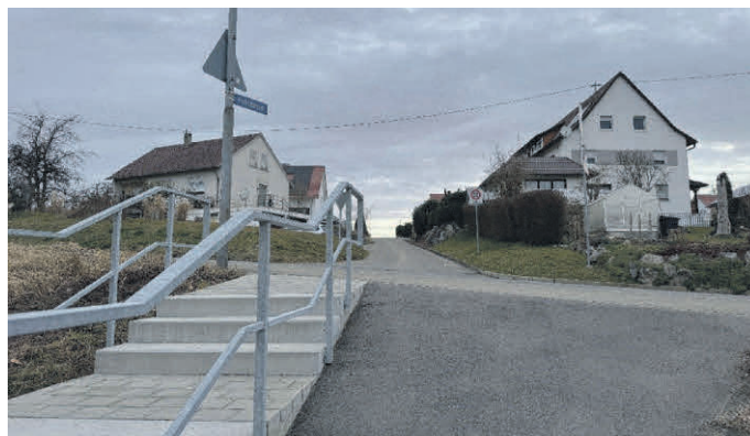
Nach der Querung der Fischbacher Straße wird die Stromleitung an der Treppenanlage vorbei zur Adlergasse weitergeführt.

Im Ochsenhauser Teilort Mittelbuch werden ab Ende März durch die NetzeBW neue Stromleitungen verlegt. Deshalb kommt es zu Einschränkungen für die Fußgänger und den Fahrzeugverkehr. Beginnend in der Fischbacher Straße werden die Leitungen entlang der Adlergasse über die Fischbacher Straße bis zur Dietenwenger Straße verlegt. Während der Bauarbeiten werden sowohl Fußgänger als auch sämtliche Fahrzeuge umgeleitet. Um die Behinderungen so gering als möglich zu halten, wird es größtenteils nur eine halbseitige Sperrung geben. Teilweise wird der Verkehr auch mit einer Ampel an der Baustelle vorbeigeleitet. Die Bushaltestelle „Adler“ wird trotz der Bauarbeiten weiterhin von den Bussen bedient. Die Bauarbeiten beginnen am Montag, 31. März, und werden bis voraussichtlich 28. Mai dauern.