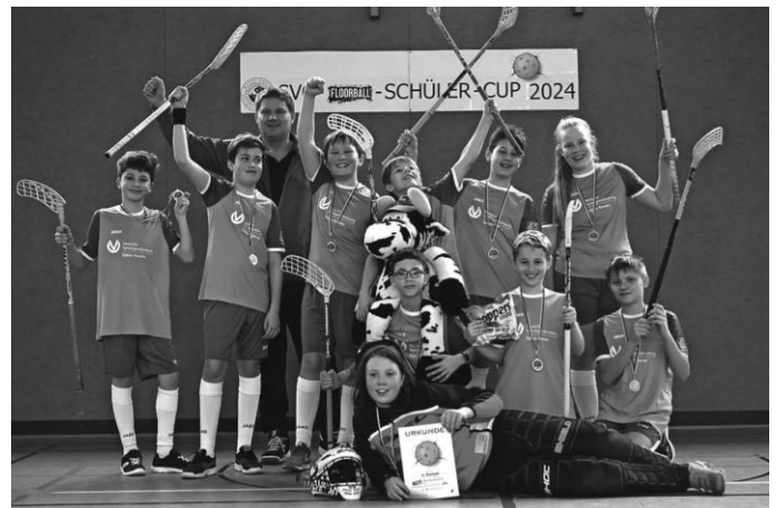
Das SVO U13 Team