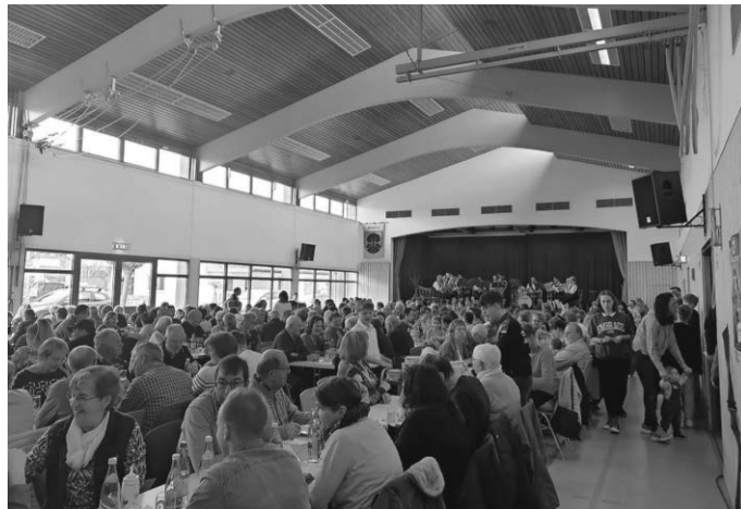
Schwäbisches Essen Musikverein Mittelbuch

die Bläserklasse, welche in Kooperation mit der Grundschule Mittelbuch aus der 3ten und 4ten Klasse besteht, gestaltet. Ein besonderer Dank gilt an alle Eltern, die ihre Kinder für eine Ausbildung beim Musikverein fördern. Über einen Zuwachs, sowohl von Jungmusikern als auch von Fortgeschrittenen, freuen wir uns jederzeit. Der Einstieg in die Musik ist in jedem Alter möglich.