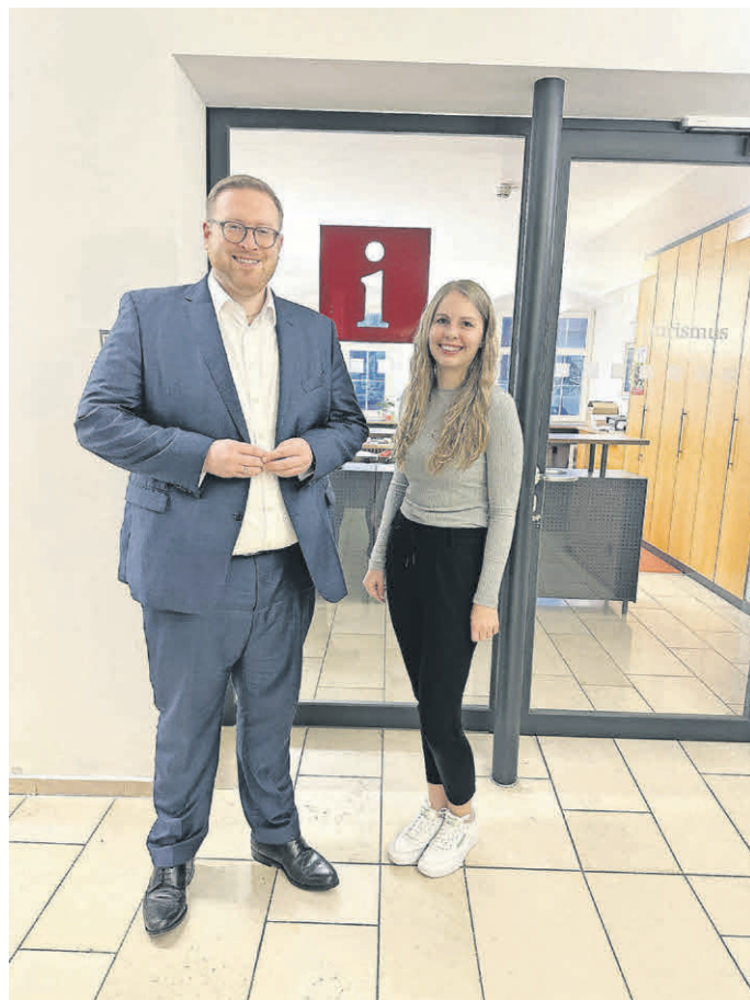
Die Tourist-Information zieht ebenfalls vom Marktplatz 1 in die Bahnhofstraße 11 um.

Für nicht aufschiebbare Angelegenheiten steht den Bürgern am Donnerstag, 18.04., von 8 bis 12 Uhr die Ortsverwaltung Mittelbuch und von 14 bis 17:45 Uhr die Ortsverwaltung in Reinstetten zur Verfügung. Auch am Freitag, 19.04., ist für dringende Angelegenheiten von 8 bis 12 Uhr die Ortsverwaltung in Reinstetten erreichbar.