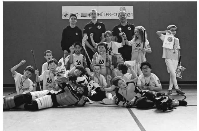
Die beiden SVO U11 Teams mit ihren Trainern