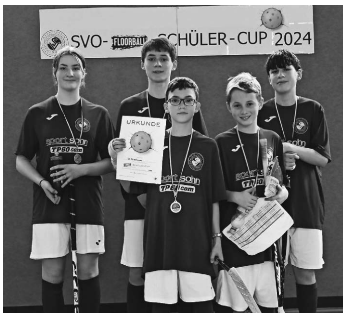
Das SVO U15 Team

Das nächste Floorball Turnier in Ochsenhausen findet am 7. Juli in der Dr.-Hans-Liebherr Sporthalle statt.