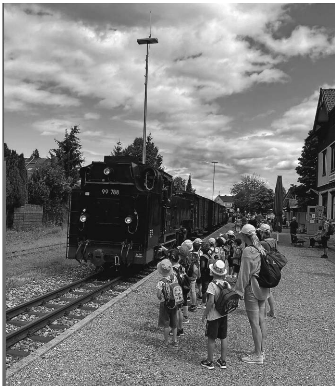
Gleich geht's los... mit Spannung wird das Öchle erwartet!