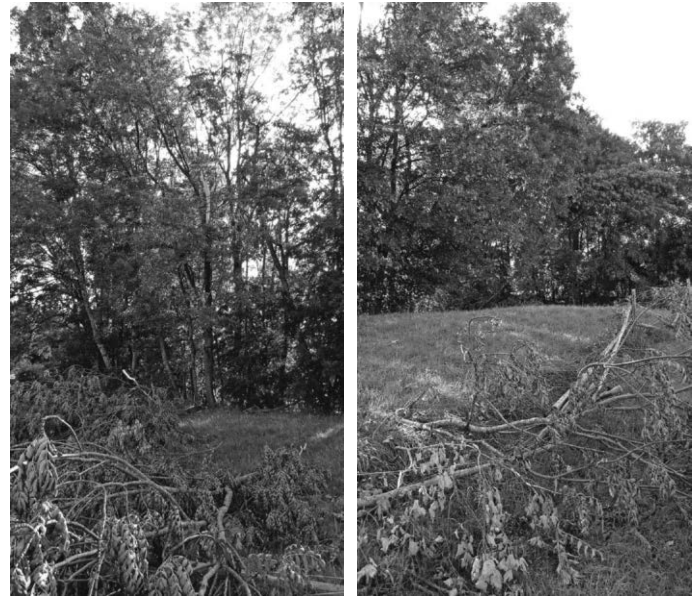
Auswirkungen des Klimawandels: Sturmsauswirkungen Sturm

Internet: https://kneippvereinochsenhausenev.weebly.com