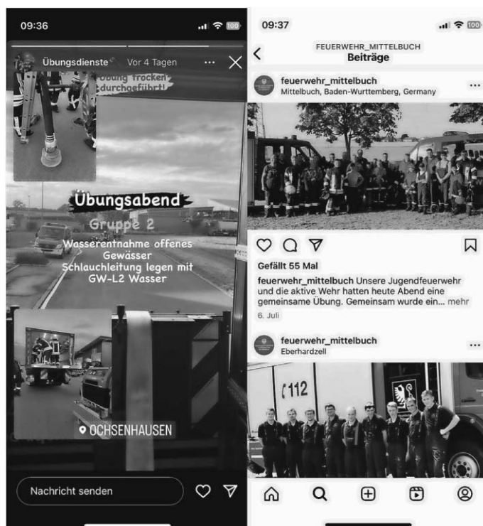
Auszug aus den Instagram-Profilen

Die Abteilungen Mittelbuch und Ochsenhausen sind zwischenzeitlich mit eigenen Profilen auf der Social Media-Plattform Instagram vertreten. Damit wird das Informationsangebot über die Arbeit in einer Feuerwehr attraktiv und modern ergänzt. Auch Einblicke in die Tätigkeiten einer Jugendfeuerwehr werden gegeben. Die beiden Profile heißen @feuerwehr_mittelbuch und @feuerwehrochsenhausen