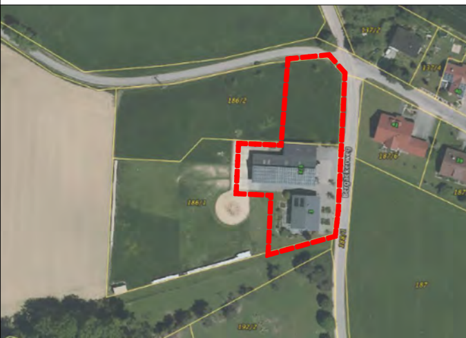
Luftbild M. 1:2500