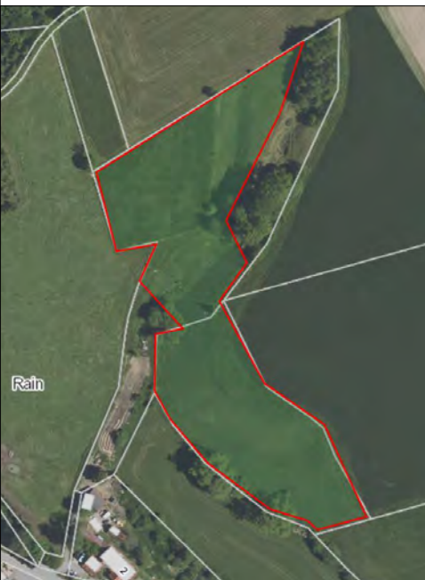
externe Ausgleichsmaßnahme - Fläche für die Pflanzung von Obstbäumen