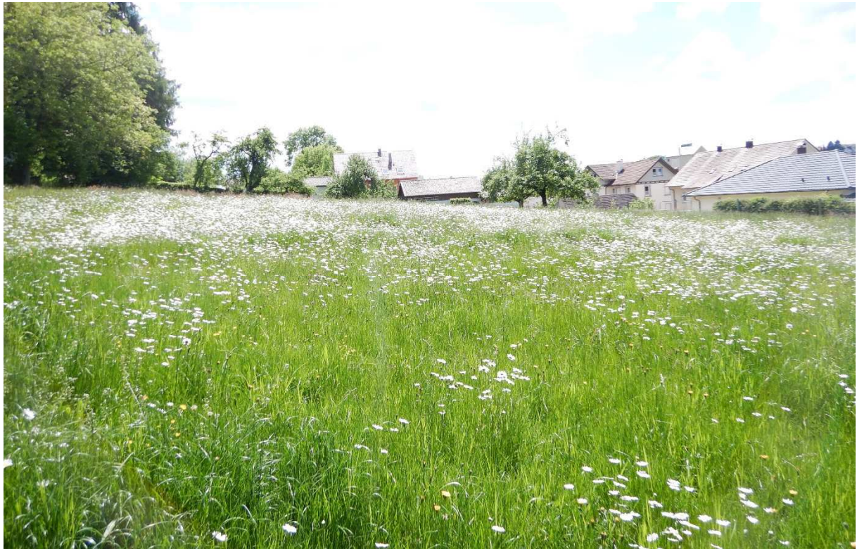
Frisch-/Fettwiese im östlichen Teil der Vorhabenfläche.