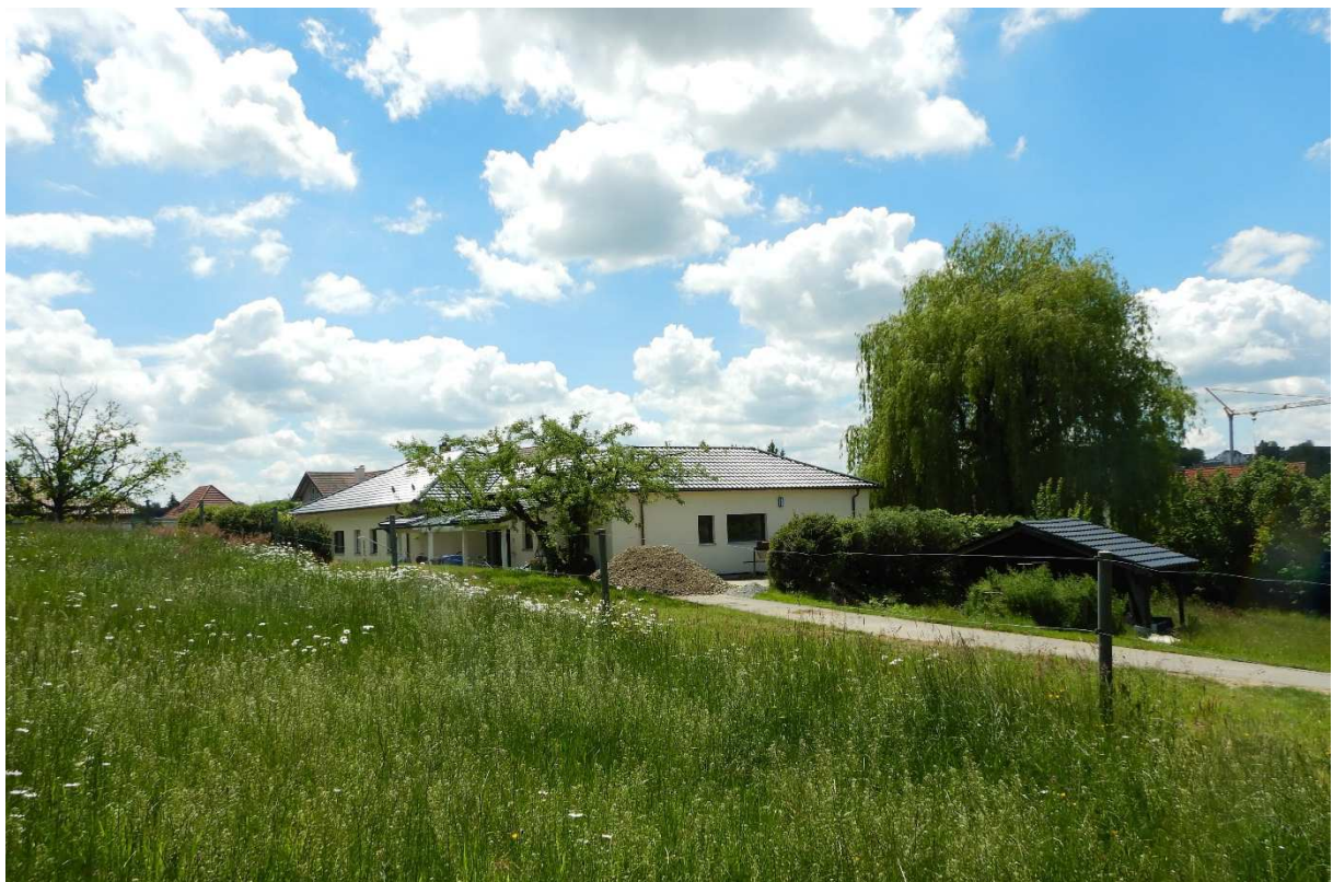
Wohnhaus im westlichen Teil des Plangebietes liegend.