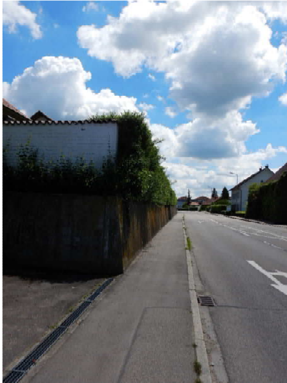
Mauer und Hecke, die das Plangebiet nach Westen zur Ulmer Straße abgrenzen.